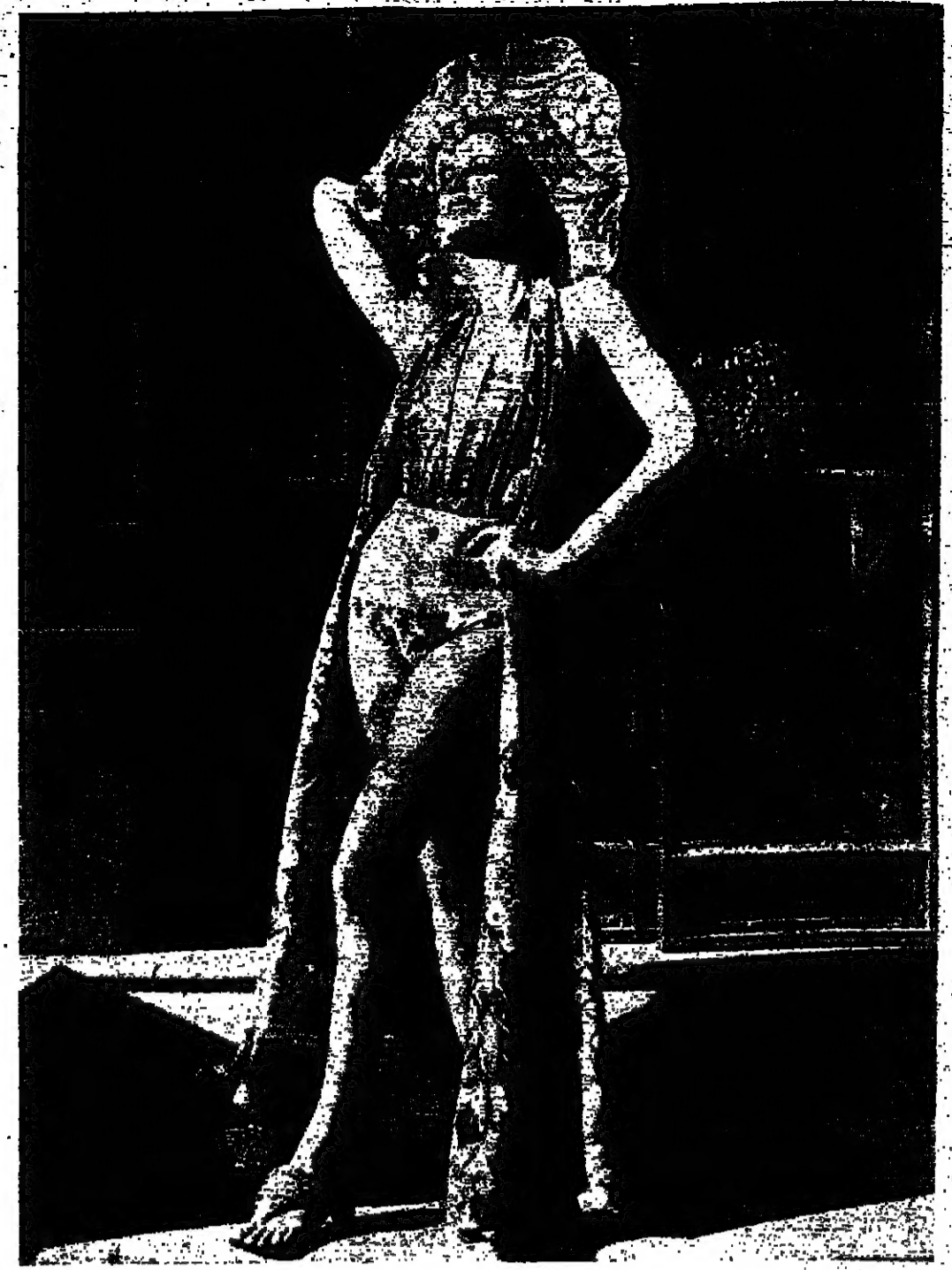
زي ليجر ينكر عرض فيروما ضمن مجموعة لصيف 1970